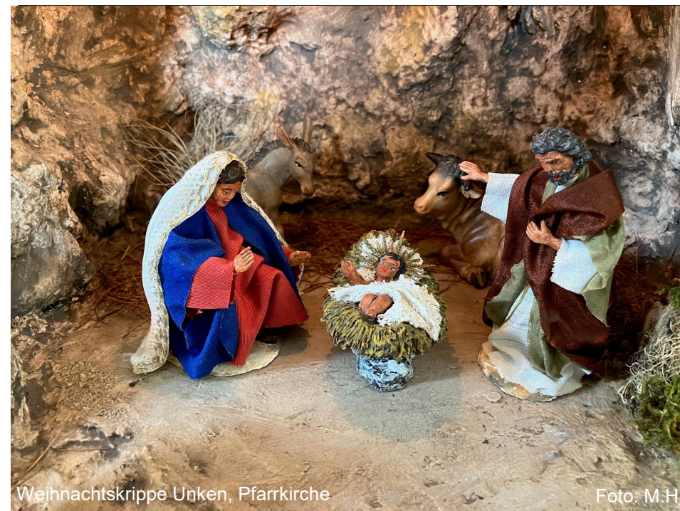
Weihnachtskrippe Unken, Pfarrkirche